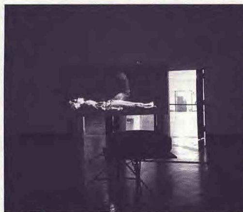
Vue d'exposition Ana Torfs, « The Magician and the Surgeon » 2020 Bozar © Ana Torfs

des phrases et de l'autre, il ravive le sens des mots tout en s'accordant aussi bien aux efforts de la forme noire qu'à sa tâche chimérique. Le fond de la salle est baigné par les couleurs de Sideshow , un film réalisé pour l'exposition en utilisant la technique du stop-motion. Sur l'écran, des personnages masqués, et costumés apparaissent l'un après l'autre sur un écran. A la fois réjouissants et inquiétants, ils se meuvent curieusement dans un décor abstrait aux lumières baroques et changeantes. On y reconnaît un clown, une geisha, un homme-oiseau, ou encore une femme-chat. On pense au théâtre, aux foires, au cinéma, mais la précision des mouvements, la justesse des jeux de couleur, le décor m'évoque surtout les spectacles du Bauhaus.